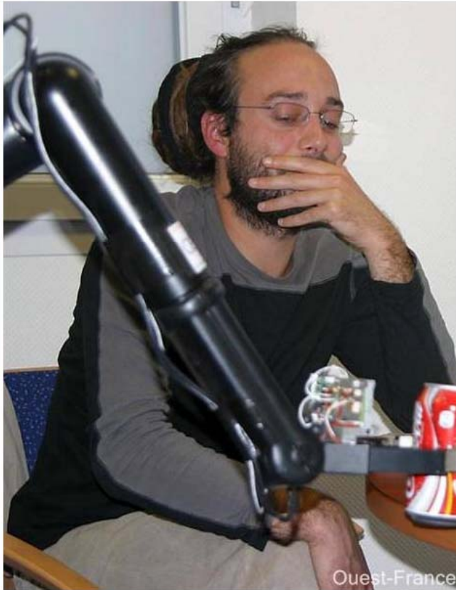
Le bras télescopique du robot compagnon attrape une cannette.

Deux technologies de pointe sont testées à Brest. L'une d'elles, pour la rééducation des bras, fonctionne sur le même principe qu'une console de jeu.